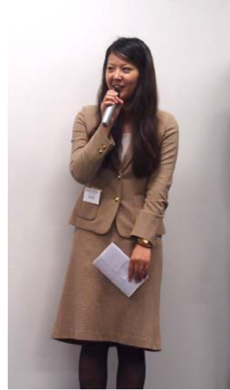
最優秀賞受賞の様子