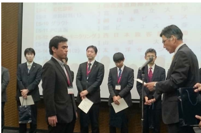
優秀講演賞受賞式