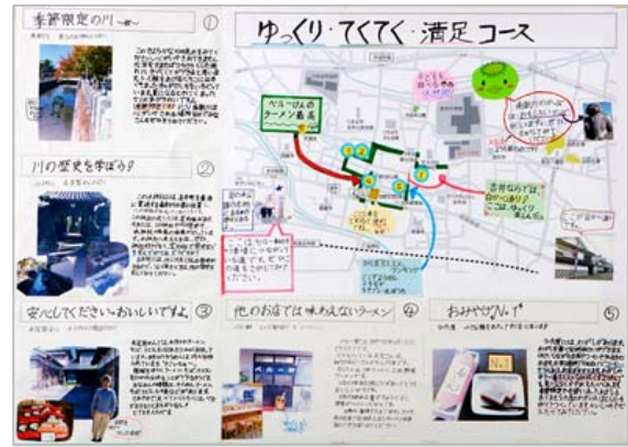
観光マップ発表会1位の作品