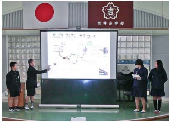
観光マップ発表会で1位の発表の様子