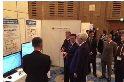
[当社出展ブースでの中谷元前防衛大臣]