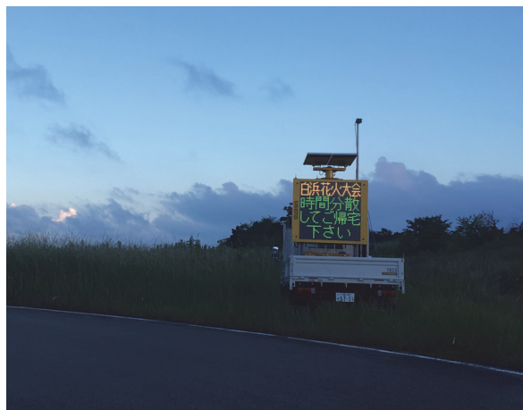
①臨時駐車場における掲示板の設置