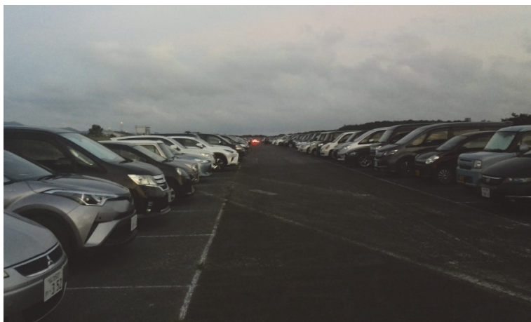
①旧滑走路における臨時駐車場の設置