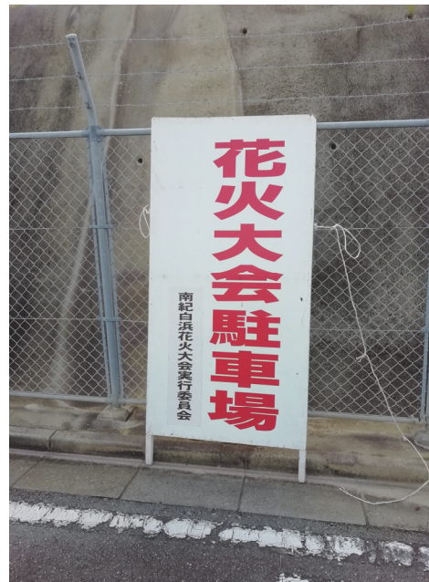
②臨時駐車場への案内看板の設置