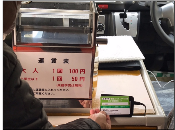
写真 コミュニティ交通乗降時の様子