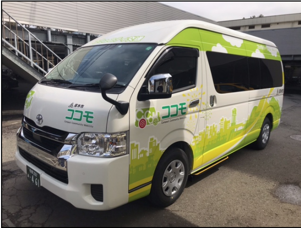
写真 厚木市地域コミュニティ交通「ココモ」

https://www.city.atsugi.kanagawa.jp/machiit/toshi/transporte/d051218.html 】