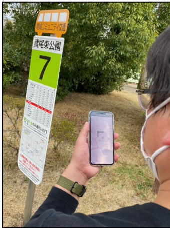
写真 スマートフォンによる位置情報提供の様子