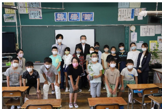
参加児童との集合写真