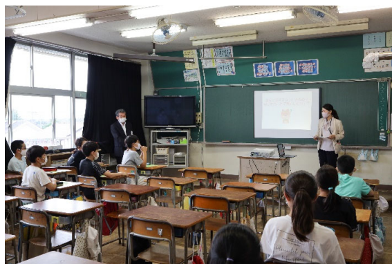
緑についての講義の様子