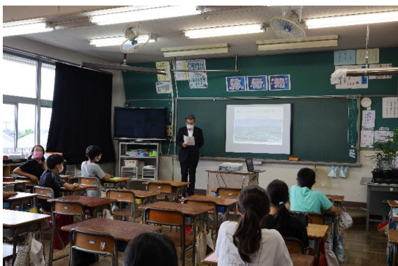
町田代表取締役社長の挨拶