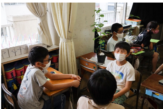
ネームプレート作成の様子