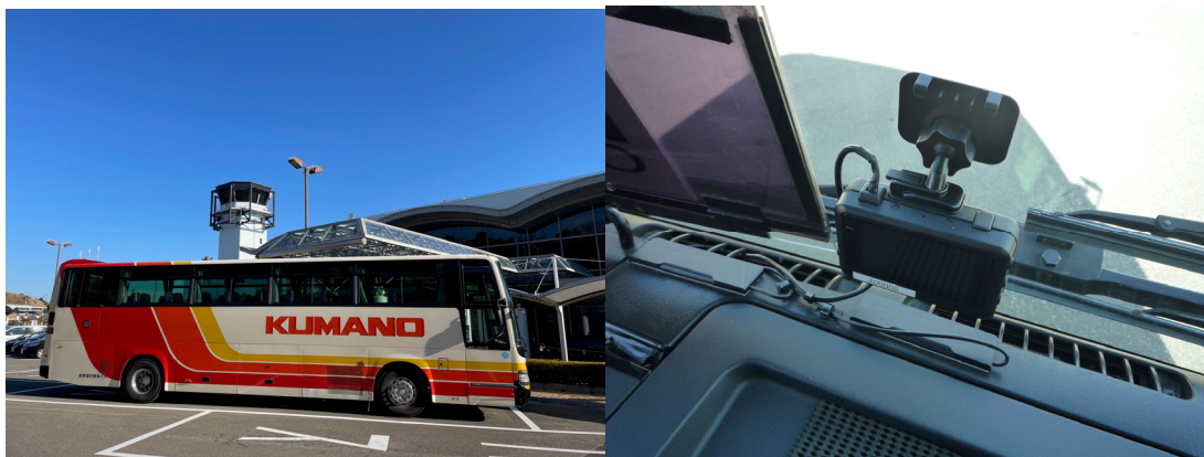
空港リムジンバス（全景）

https://www.mlit.go.jp/sogoseisaku/maintenance/03activity/pdf/05_19.pdf