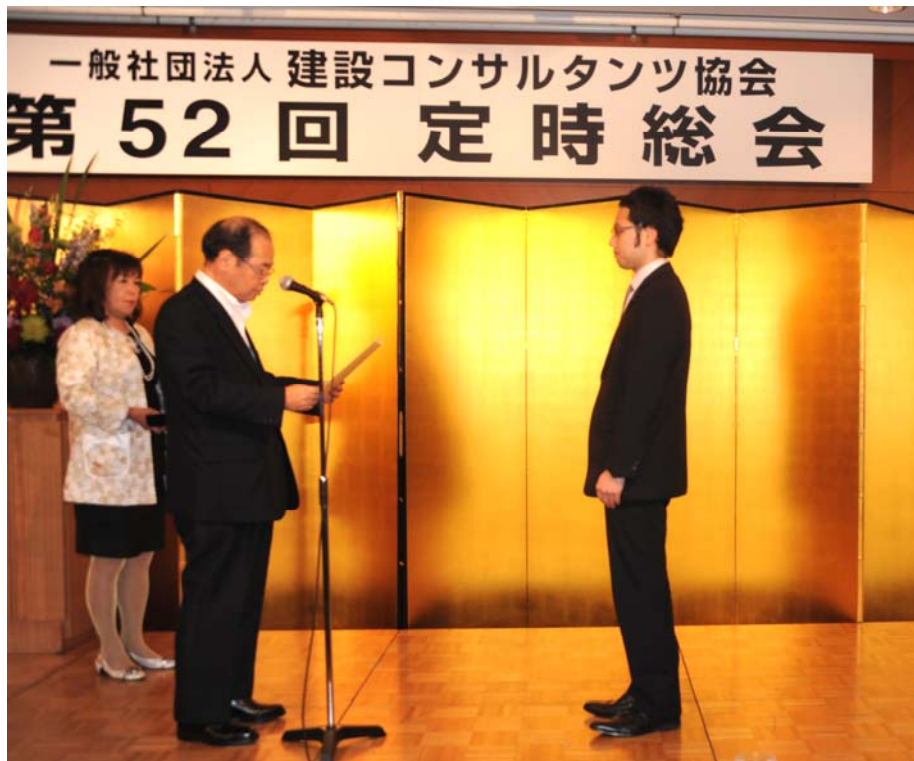
最優秀賞の受賞の様子