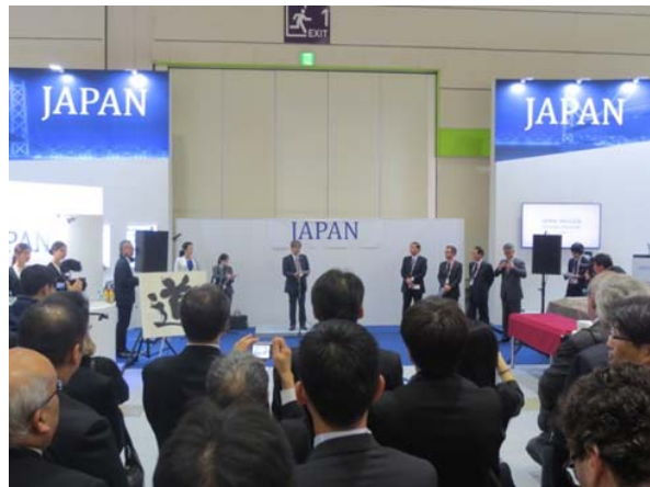
◆日本ブース・メインステージの様子