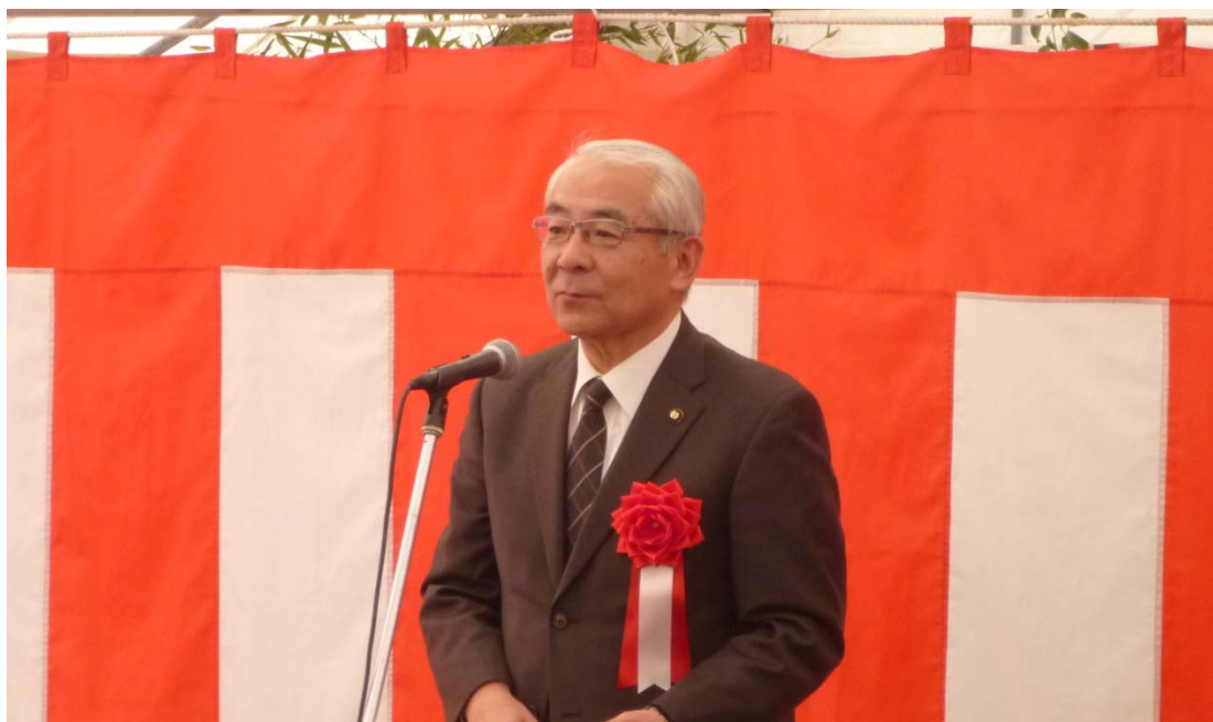
青山 節児 中津川市 市長