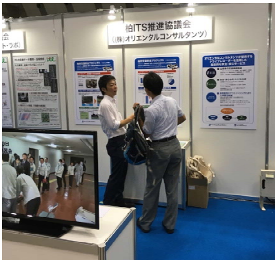
展示会場での説明風景

名 称 : ITSテクノロジー展 主 催 : フジサンケイ ビジネスアイ（日本工業新聞社） 開 催 日 : 平成 28 年 9 月 28 日（水）～30 日（金） 会 場 : 東京ビッグサイト〔東京国際展示場〕東ホール 〒135-0063 東京都江東区有明 3-11-1