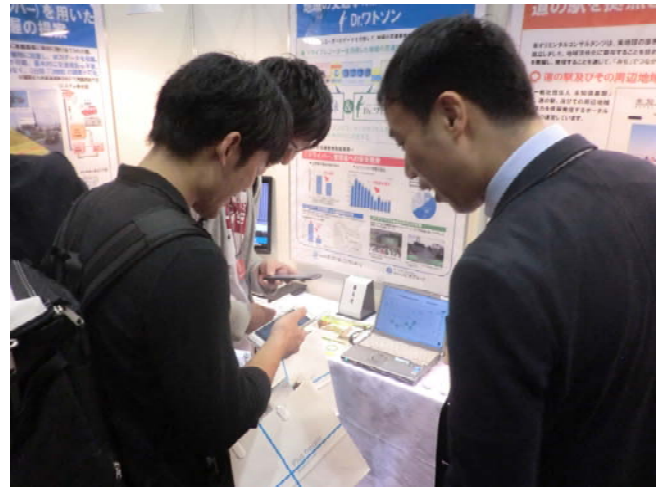
【展示会場での説明風景】