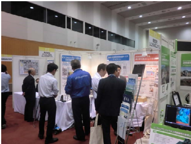
【当社の出展ブース】