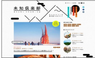
未知倶楽部のホームページ

「一般社団法人 未知倶楽部」は、道の駅、及びその周辺地域の魅力を情報発信するポータルサイトの運営をしています。