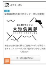
KDDI auスマートパス 画面

「auスマートパス」を活用して割引や優待サービスのクーポンを配信するプロモーション、新たなサービス・魅力の創出にむけて百貨店等との連携による催事の企画・運営をしています。