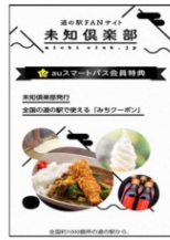
未知倶楽部クーポン画面