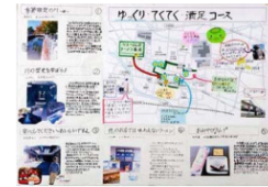
手作り観光マップ