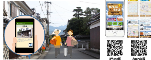
観光情報やクーポンを観光客のスマートフォンに配信

ビーコンセンサーから地域の観光情報、クーポンなどをスマートフォンに配信するプロジェクトを実施しました。