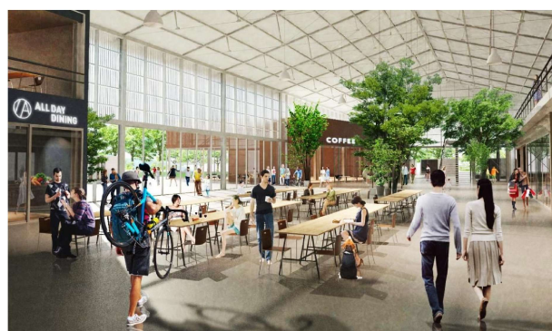
図 ラウンジイメージ