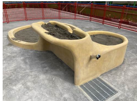
子どもたちのアイデアを活かした遊具

（左：複数人や寝そべても利用できるブランコ、右：車いすやバギーに乗ったまま遊べる砂場）