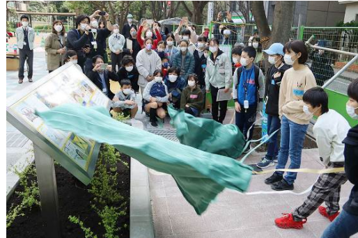
公園お披露目会のようす（左：集合写真、右：モニュメント除幕式）