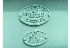
建設時からの銘板