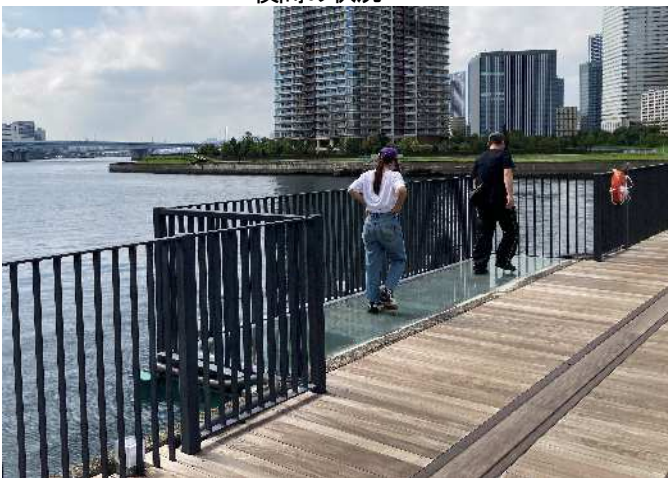
ガラス床の展望テラス