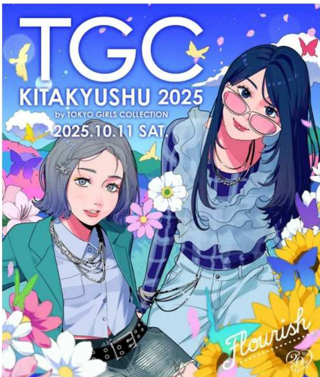
▲TGC 北九州 2025 キービジュアル

株式会社フーディアは、「TGC 地方創生プロジェクト」の意向に賛同し、福岡県商工部観光局観光振興課や北九州市産業経済局地域・観光産業振興部 MICE 推進課、また北九州市立大学と連携し、地域の魅力ある食材を使用したスペシャルメニューやご当地グルメを提供いたしました。福岡県産品や北九州市のご当地グルメ、食材のPRを行うメニューも作成し、出演者に配布するなど、食の魅力を発信いたしました。