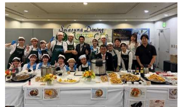
▲ケータリング会場