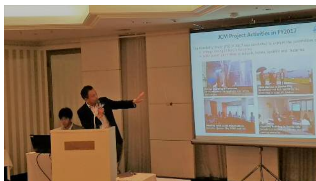
当社/猪爪 海外事業部副事業部長によるプレゼン