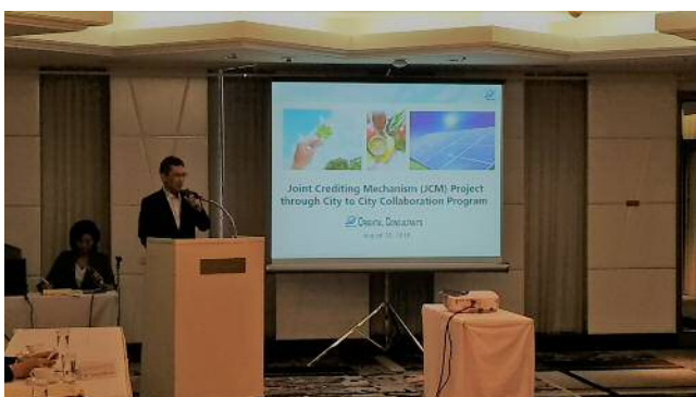
当社/堤 海外事業部長による挨拶