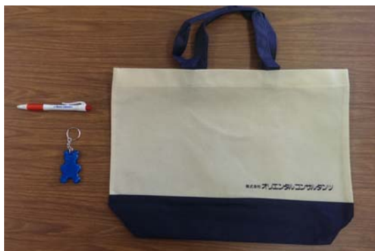
ノベルティグッズ (エコバッグ・くまさん反射板キーホルダー・ボールペン)