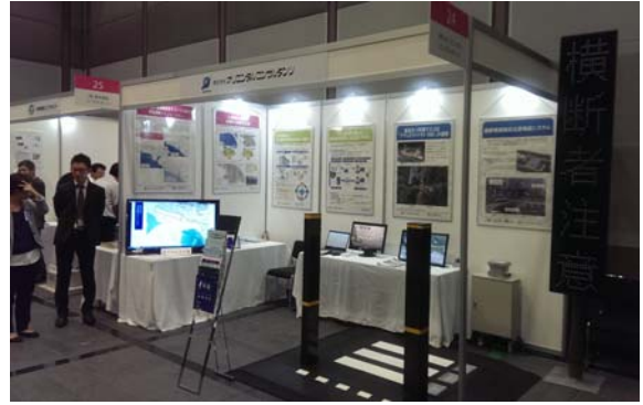
ブース 入口寄り 全景