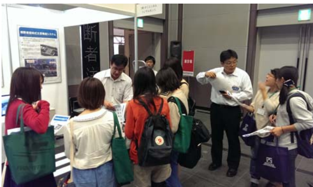
リクルート活動風景