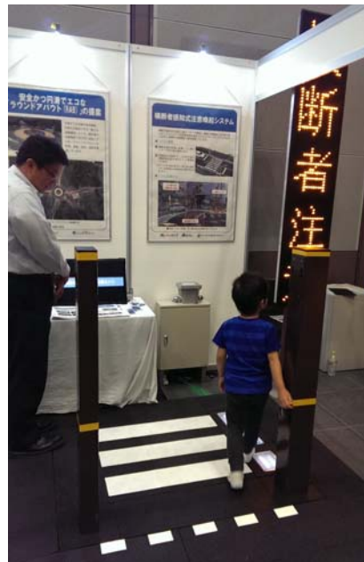
横断者注意喚起システム